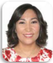
Dip. Lizbeth Loy Gamboa Song PRI